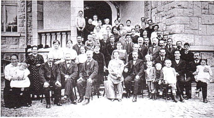
Die Gemeinde 1920