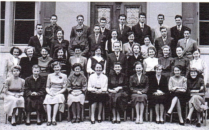
Jugend der 30er Jahre