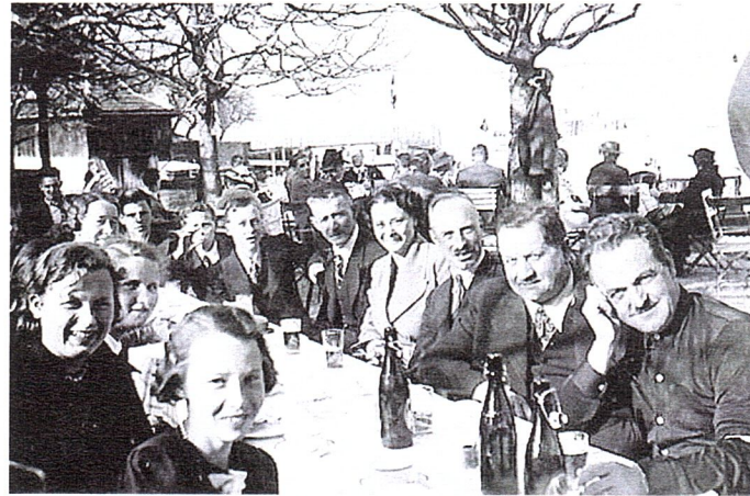
Ein guter Grund zum feiern: nach der Konfirmation 1938