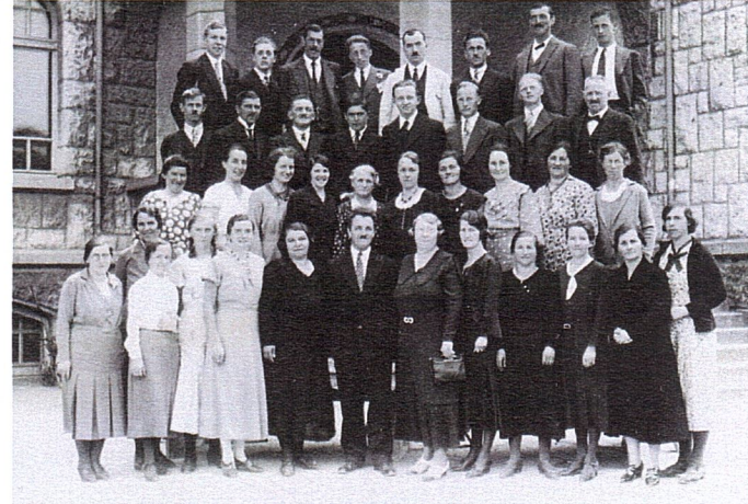
Thuner Chor in den 1930-40er Jahren